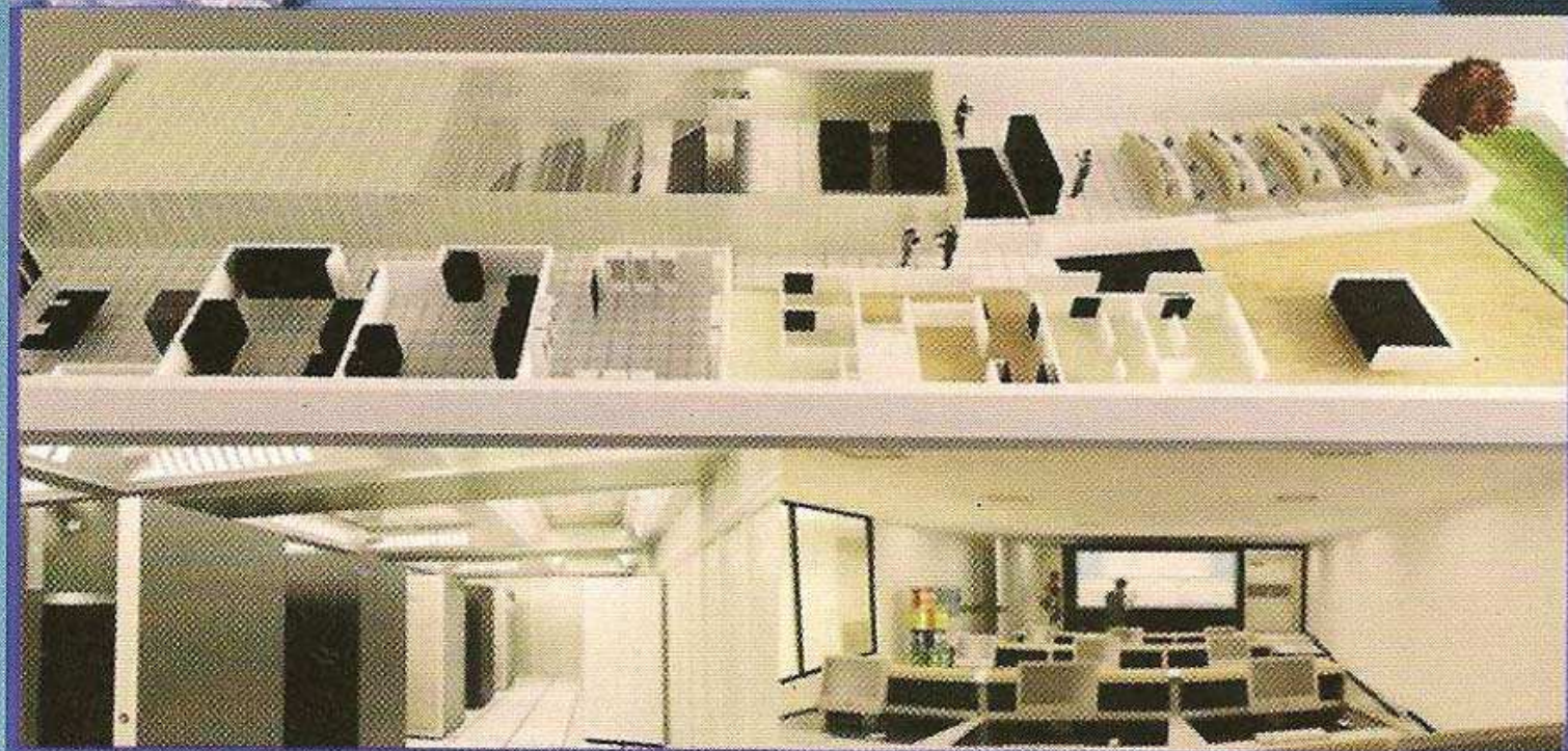
Maqueta Proyecto Área de Máxima Seguridad